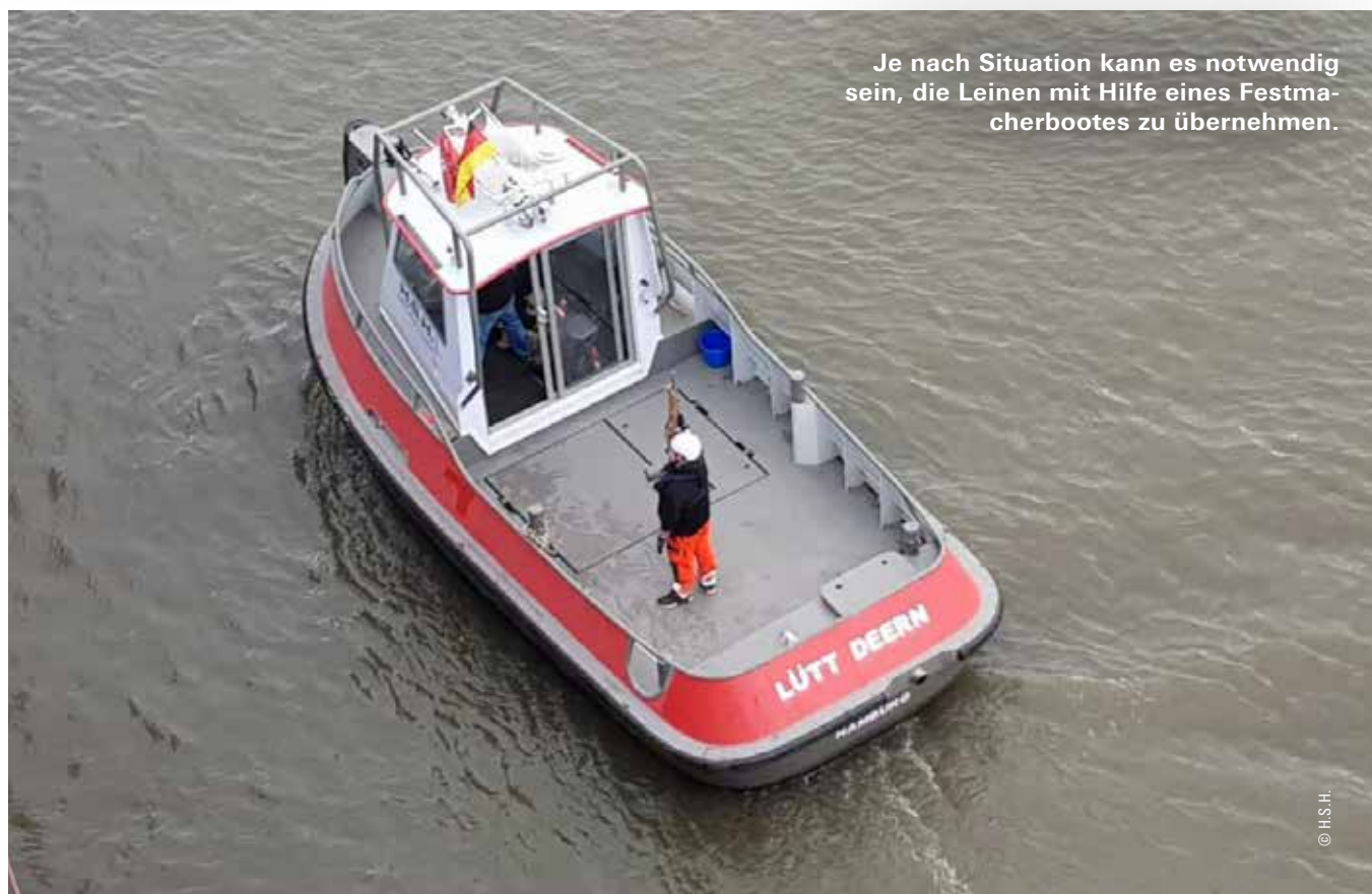
Je nach Situation kann es notwendig sein, die Leinen mit Hilfe eines Festmacherbootes zu übernehmen.

An Nachwuchs fehlt es H.S.H. nicht: „Der kommt bei uns zu 80 Prozent von Aushilfen, die uns neben