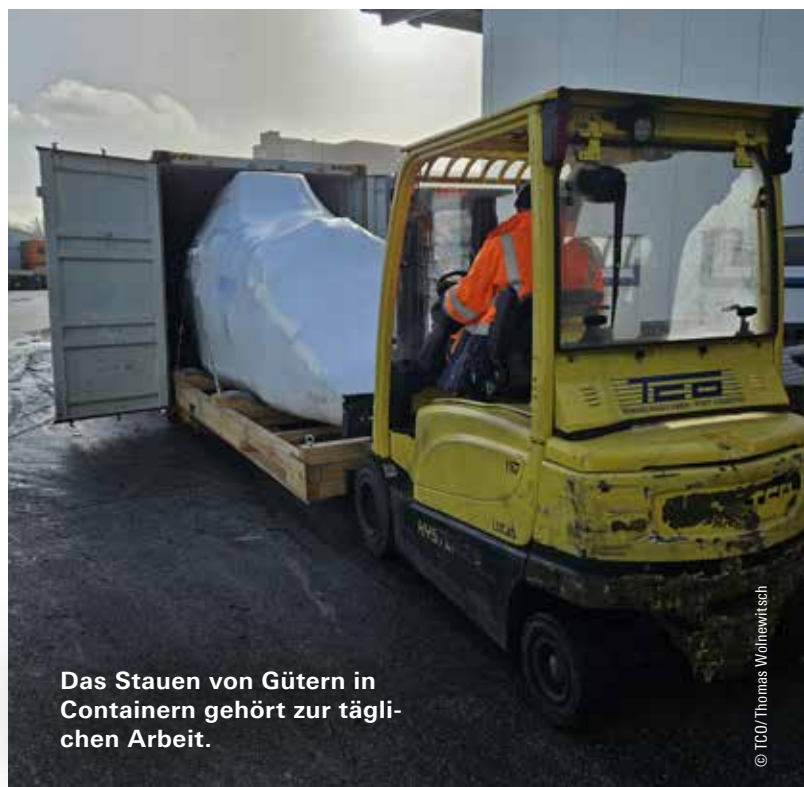
Das Stauen von Gütern in Containern gehört zur täglichen Arbeit.

Softskills: Interesse an Planung, Organisation, Rechnen und Kommunikation sowie Arbeiten im Freien bei jedem Wetter