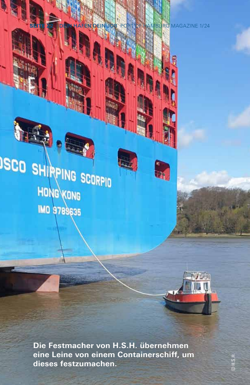
Die Festmacher von H.S.H. übernehmen eine Leine von einem Containerschiff, um dieses festzumachen.