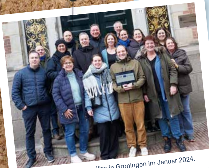
Eines der ersten Projekttreffen in Groningen im Januar 2024.

Weitere Informationen sind auf der Projektwebseite www.interregnorthsea.eu/GRIT zu finden.