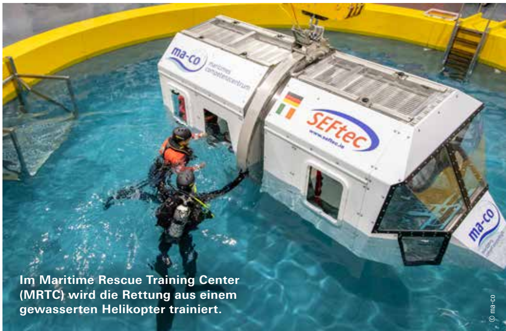
Im Maritime Rescue Training Center (MRTC) wird die Rettung aus einem gewässerten Helikopter trainiert.

Projekt PortSkill 4.0. In den vergangenen zwei Jahren haben wir viele Gespräche geführt und die Ergebnisse analysiert. Dabei hat sich gezeigt, dass sich im Hafen viel bewegt. Die digitale Transformation wird in vielen Bereichen umgesetzt. Wir haben für uns erkannt, dass wir jetzt die Zukunftskompetenzen eindeutig identifizieren müssen, um hierfür Trainings und Kurse zu entwickeln.