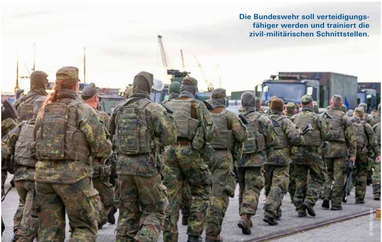
Die Bundeswehr soll verteidigungsfähiger werden und trainiert die zivil-militärischen Schnittstellen.

Sie verschaffen ein realistisches Lagebild über die Sicherheitsmechanismen im Hafen, bei der Bundeswehr und in den beteiligten Unternehmen. Wenn Szenarien