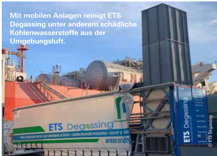
Mit mobilen Anlagen reinigt ETS Degassing unter anderem schädliche Kohlenwasserstoffe aus der Umgebungsluft.

Ihr Firmensitz ist in Amelinghausen bei Lüneburg und damit südlich von Hamburg. Haben Sie auch Aktivitäten in Hamburg geplant?