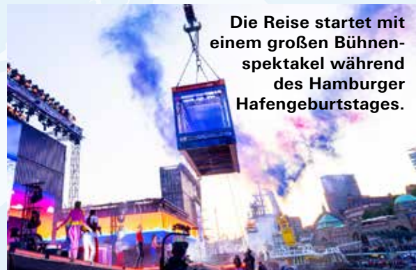
Die Reise startet mit einem großen Bühnenspektakel während des Hamburger Hafengeburtstages.

An jeder Station zog der Container mit seinem leuchtenden Blau die Blicke auf sich. Er erinnerte an das Hamburger Lichtkunstprojekt Blue Port von Lichtkünstler und Theatermacher Michael Batz, das in diesem Jahr den Hafen zum zehnten Mal in ein magisches Licht taucht. Entsprechend