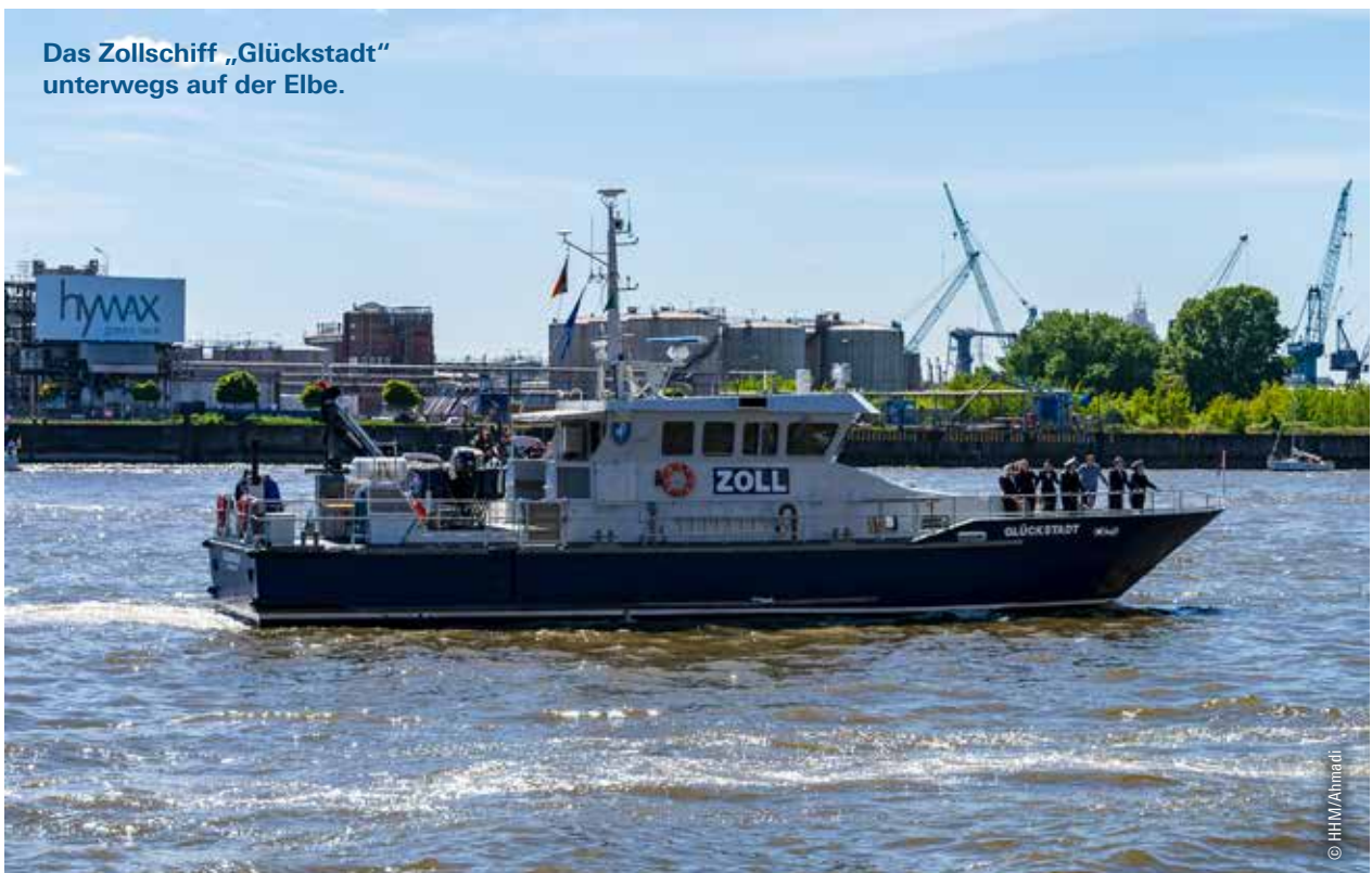
Das Zollschiff „Glückstadt“ unterwegs auf der Elbe.

Mein zweiter Eindruck: Im Hafen ist die Vernetzung außergewöhnlich gut – sowohl zwischen den Behörden als auch mit der Wirtschaft. Genau diese enge Verzahnung zählt zu den Grundpfeilern des Erfolgs. Der Zoll hat im Hafen eine Doppelrolle: Wir müssen Sicherheit gewährleisten und zugleich Abgaben für Bund und EU sichern. Mit unseren Kontrollen leisten wir zudem einen wichtigen Beitrag zum Verbraucher-, Arten- und Markenschutz sowie zu weiteren gesellschaftlich relevanten Bereichen. Gleichzeitig verstehen wir uns als Partner der Wirtschaft. Legalem Handel dürfen wir keine unnötigen Hürden in den Weg legen. Das gelingt nur, wenn alle Beteiligten im Hafen weiterhin im engen Austausch bleiben und mit Verständnis für die jeweiligen Prozesse gemeinsame Lösungen entwickeln. Dazu möchte ich aktiv beitragen.