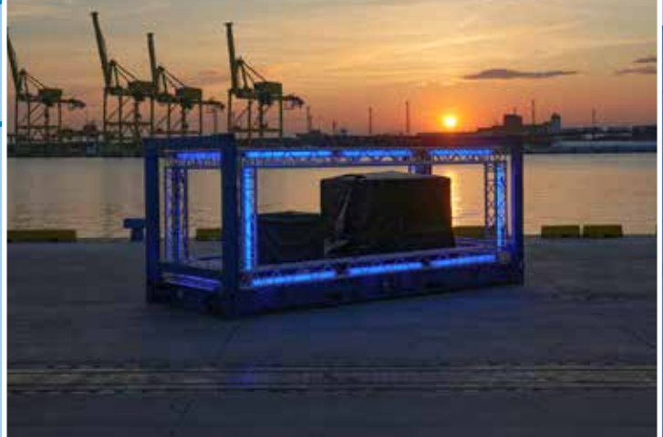
Die Blue Box steht in Triest auf dem Gelände von HHLA PLT Italy.

Der illuminierte Container steht für das Selbstverständnis der HHLA als europäischer Netzwerklogistiker, der Menschen, Güter, Daten und Ideen miteinander verknüpft. Er zeigte, wie Europa am besten funktioniert: mit der „Power of Networks“. ■